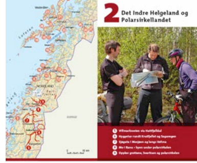
Eksempler på noen av oppslagene i boka. 8 kapitler, 30 turer, 256 sider.